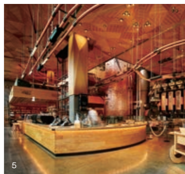
1 3Fのカウンターテーブルにコーリアン®を使用。カウンターの中には焙煎機。 2 2Fから1Fを覗く。スタッフの作業するテーブルはコーリアン®で統一されている。 3 2Fのティバーナ™バーでは、半円形の作業テーブルをカウンターが取り囲む。 4 3Fのアリビアーモ™バーの作業カウンター。 5 1Fから見た店内風景。